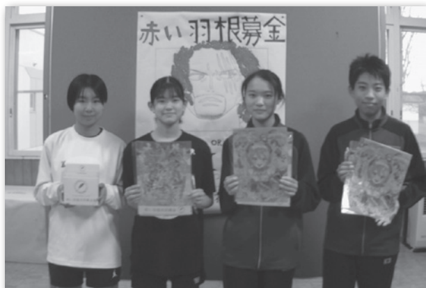
【福島中学校 生徒会のみなさん】