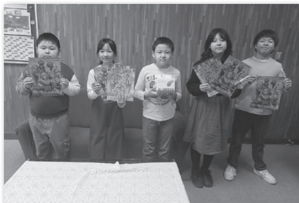
【吉岡小学校 児童会のみなさん】