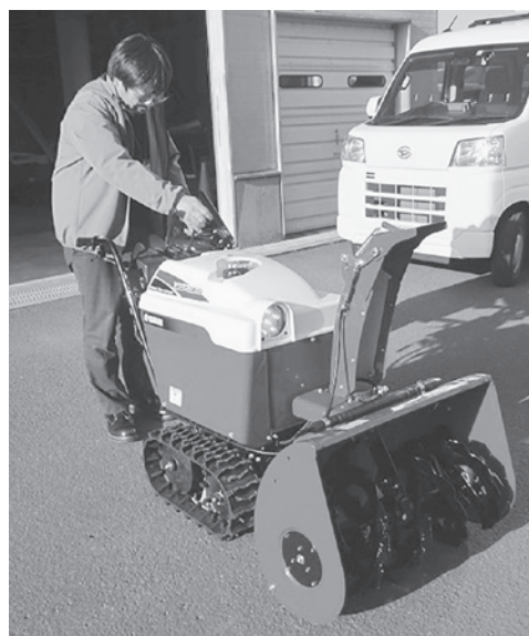
(貸出できる小型除雪機)

「今すぐやってほしい」というご要望にはお応えできない場合もありますのでご理解願います。