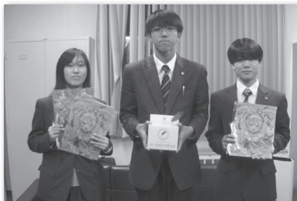
【福島商業高等学校 生徒会のみなさん】