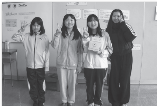
【福島小学校 児童会のみなさん】